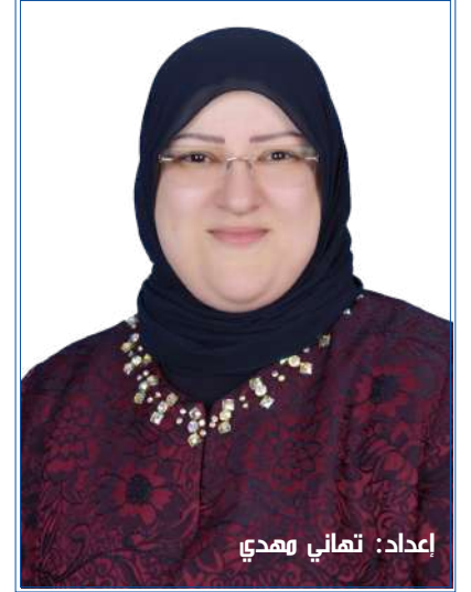
إعداد: تهاني هادي

د. ديفيد ر. هاوكينز ترجمة: أرجوان بنت سليمان